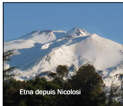
Etna depuis Nicolosi