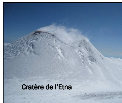
Cratère de l'Etna

Les frais de participation à ce stage s'élèvent à 50,00 € / participant , hors frais d'hébergement.